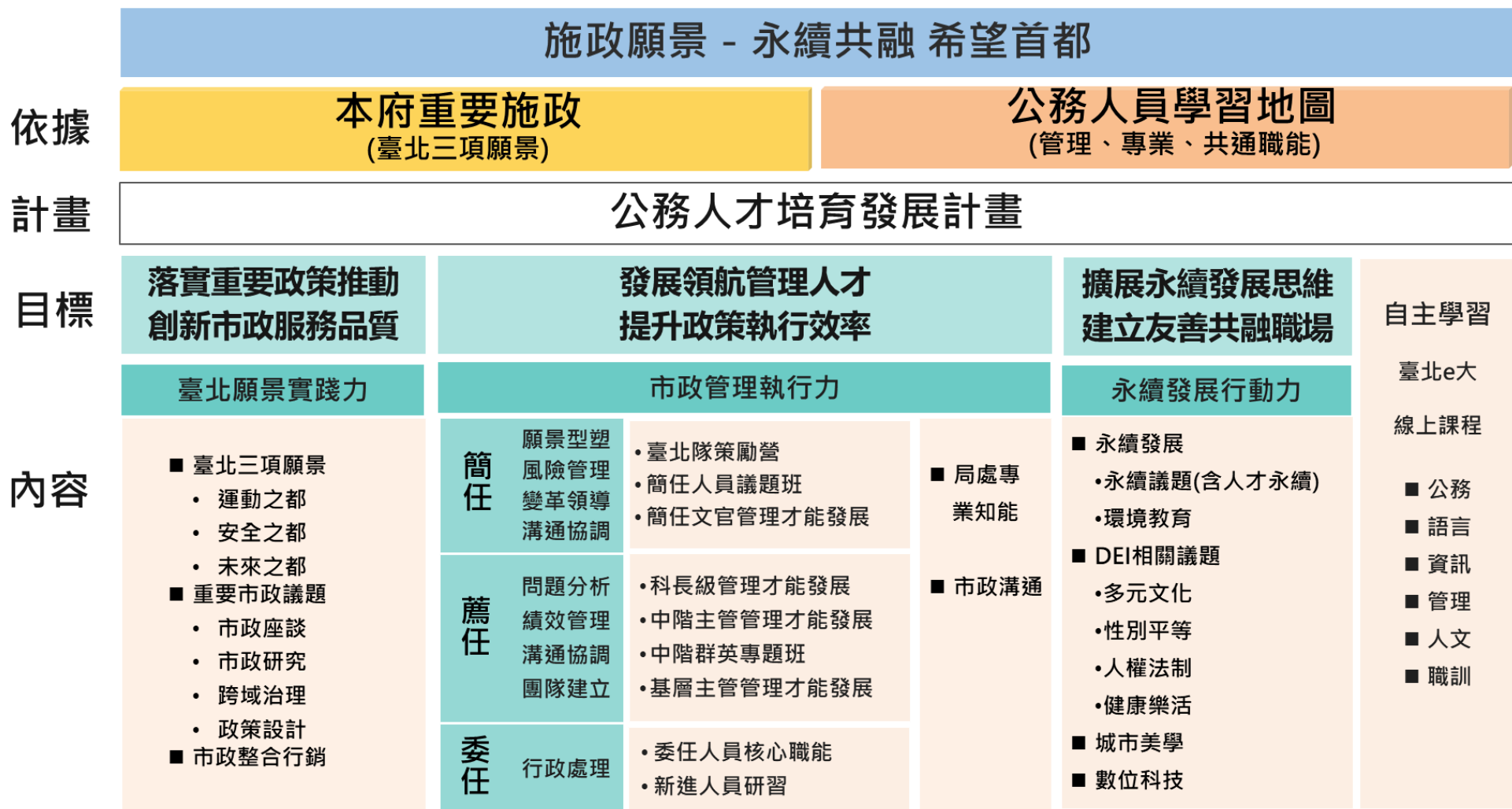
圖 1 培育發展架構圖